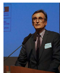
PIERRE GRENIER, MINISTRE DE L'AGRICULTURE

longue date. Le foyer a été découvert trop tard . En 2017, 30 000 souches atteintes ont été dénombrées, ce qui représente de loin le plus gros foyer du Gard. Cette situation démontre tout l'intérêt pour les vignerons de se former.